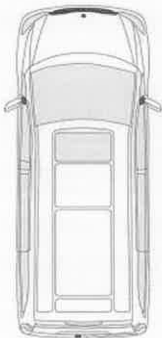
Minibus – kop - 9 plaatsen