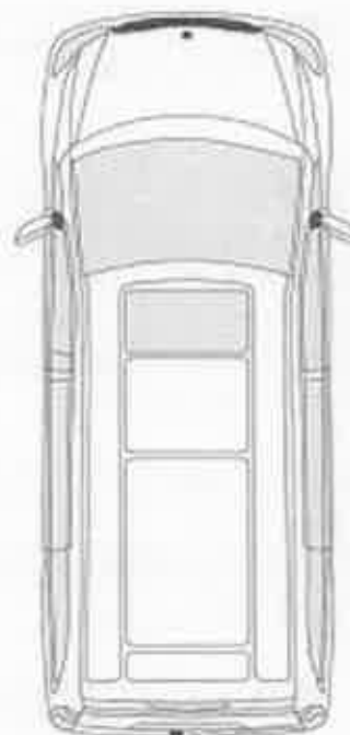
Auto - staart - 5 plaatsen

Oryx Vink Woestijnvos Vincent Schoensnavel