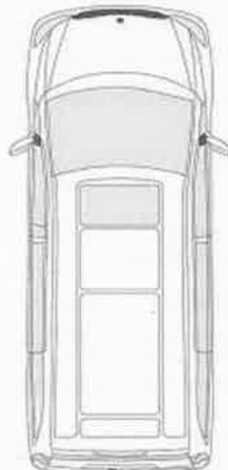
Auto – staart - 5 plaatsen

Akita Valk Woestijnvos Vincent Boomklever Schoensnavel Anthony Ewald Oran-oetang